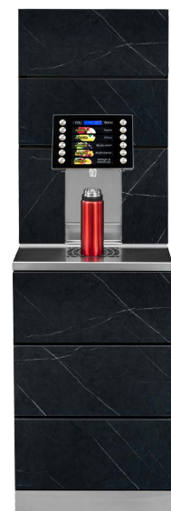
JDM ID XL mit Design ORCA