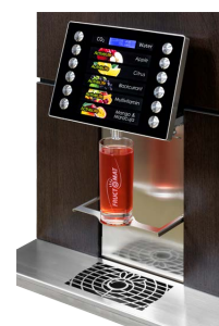
Edition Fix L