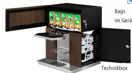
Bags im Gerät